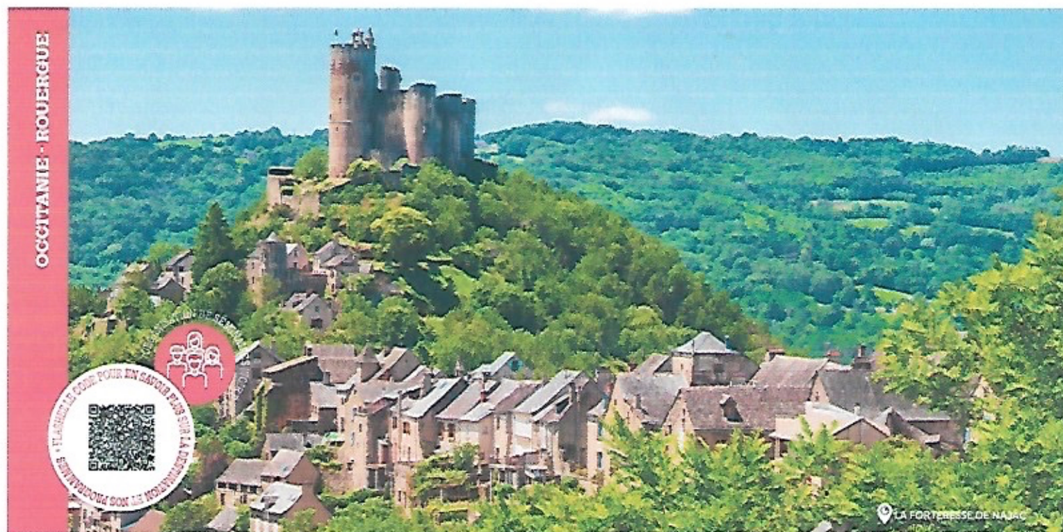
LA FORTERESSE DE NAJAC